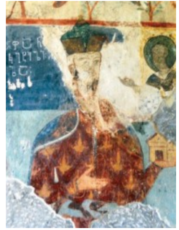
მაზა ციციშვილი – ფანასკერტელი

მაზა ფანასკერტელ-ციციშვილის მიერ შედგენილია ვრცელი სამედიცინო ნაშრომი “სამკურნალო წიგნი – კარაბადინი”, რომელშიც განხილულია როგორც თეორიული, ისე პრაქტიკული მედიცინის საკითხები. ვტორი ძირითადად ემყარება ძველი ქართული სამედიცინო გამოცდილებას, ასევე ნაწილობრივ იყენებს უცხოენოვან ნაშრომებს.