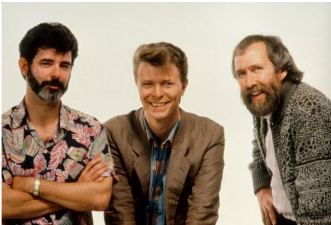
დევიდ ბოუი, “დაბირინტის” პროდუსერი ჯორჯ დუკასი და რეჟისორი ჯიმ ჰენსონი, 1985 წ.