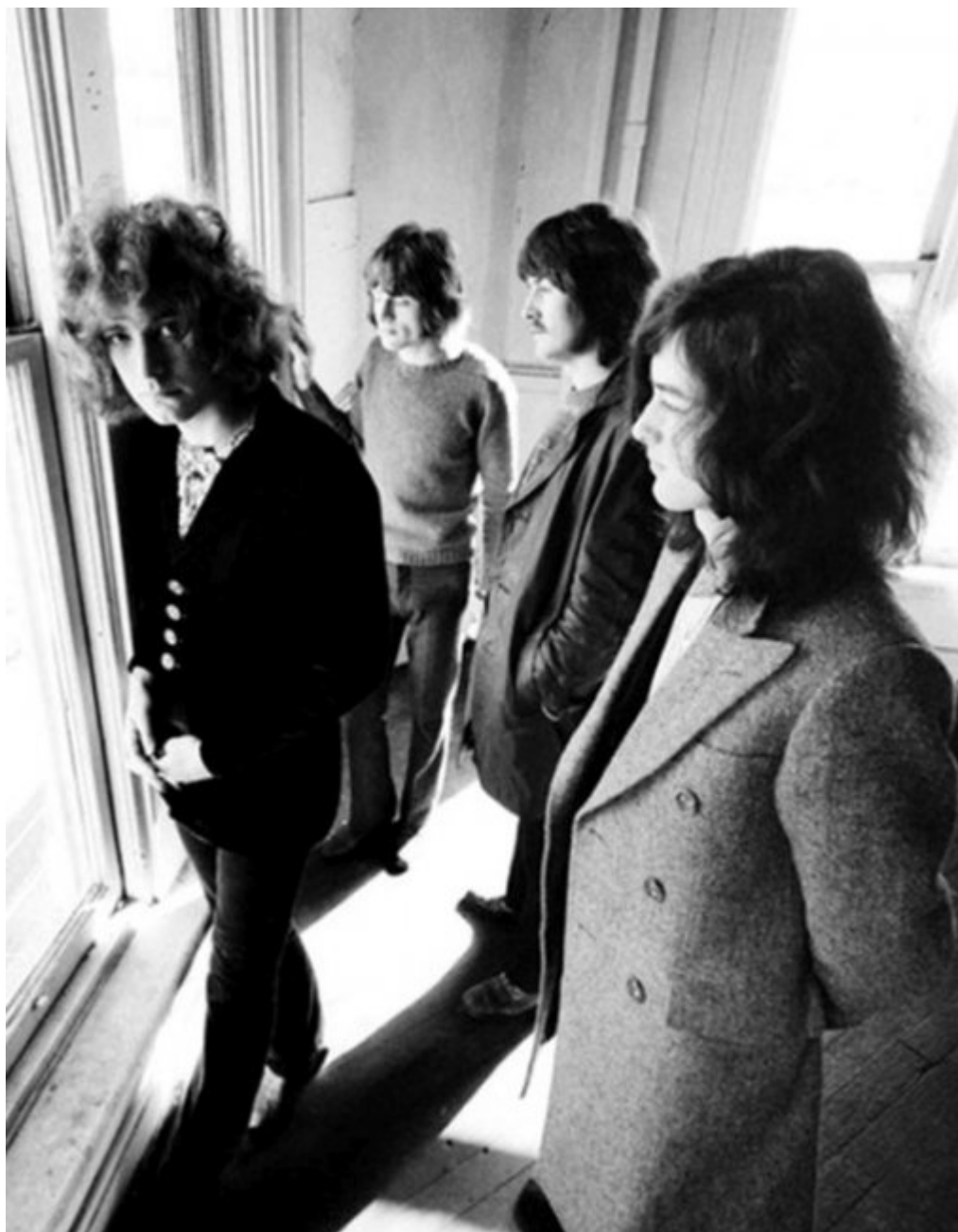
Led Zeppelin, 1969 წ.