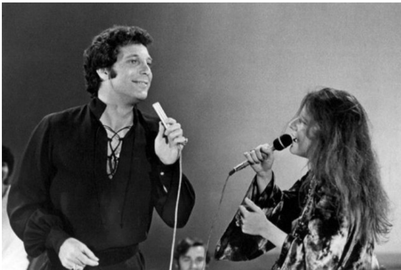
ჯენის ჯოპრინი და ტომ ჯონსი, 11 ნოემბერი 1969 წ.